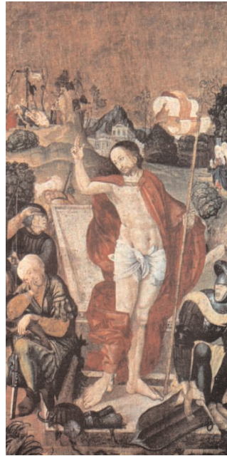
M.S. mester - csak így ismeri a művészet-történelem, Kolozsvári Tamás mellett régi festészetünk legnagyobb alakja. Feltámadás című fenti képe 1506-ból való. Esztergomi Keresztény Múzeum.

Ha el akarjuk mélyíteni anyanyelvünk húsvét szavának jelentését, akkor abba kell beagondolnunk, mi is ennek a konkrét üzenete. Annnyira nagy ünnep volt ez a Húsvét eleink számára, hogy