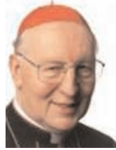
Friedrich Wetter bíboros

Február elején Münchenben ünnepei nagymise keretében emlékeztek meg Wetter bíboros 75. születésnapjáról. A szertartáson a bajor kormány Zehetmair művelődésügyi miniszter, a várost pedig Ude polgármester képviselte. Résztvett valamennyi bajor püspök, valamint Scheffczyk müncheni bíboros is. A begyült adományokat az „Akcio az életért” alapítványnak továbbították, amely várandós anyáknak segít, ha konfliktushelyzetbe kerülnek. Már ez a gesztus is jól példázza Wetter bíboros életművének egyik vetületét: mint Schick bambergi püspök az ünnepséget követő fogadáson mondta: melegsívűségével a bíboros sohasem téveszti szem elől a célt, mert nem a számítás, vagy a politika irányítja, hanem kizárólag istenhite. Mindezt megerősítette Zehetmair miniszter is, aki a bíborost egyházmegyéje első plébánosának nevezte, mert életvitelével is példát mutat híveinek.