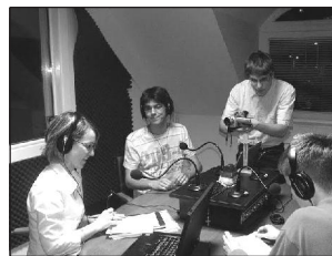
A rádióban professzionális háttérrel rendelkező, jól szervezett, rugalmas és kompetenciaalapú munkamegosztás szolgálja az evangélicizációs és missziós célokat.

Megbicsaklott világunkban biztos alapokra van szükség, ez teszi lehetővé az értéképítést. A Mária Rádió megálmodói és létrehozói ebben, azaz a keresztény Magyarország tartópilléreinek megszilárdításában elkötelezettek, miként az emberi közösségek – keresztényi érték által összekapcsolt – kohéziójának megerősítésében is. Ezt szolgálják a különböző platformok is – a nyomtatott magazin, az internetes megjelenés, a közösségi portálokra való kommunikáció –, amelyek a hívők és a hitüket keresők találkozásának kiváló és határozható módjai. (Vasvári Éva)