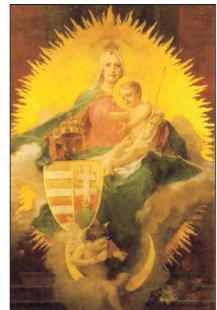
Magyarok Nagyasszonya (Rózsák terei görög katolikus templom, Budapest)

„Tiszteled a nőket!” – hangzik az etikai felszólítás, amely eljut az értelmünkig, de már ritkábban a szívünkig és a tetteinkig. Az erkölcsi parancs – túl az értelem s az akaraton – az ünnep élménye révén hatol igazán hatékonyan a szívünkbe. Nemzeti ünnepe ez számunkra, amely sürgeti a nők tisztelését, és megidézi történelmünk nagyasszonyainak emlékét. Az ő női érte- keiknek gyöngyös pártájával ajándékoz- zuk meg lélekben Boldogasszonyunkat, amikor külön ünneppel köszöntjük benne a „Magna Domina Hungarorum” cím- zettjét, a Magyarok Nagyasszonyát. □