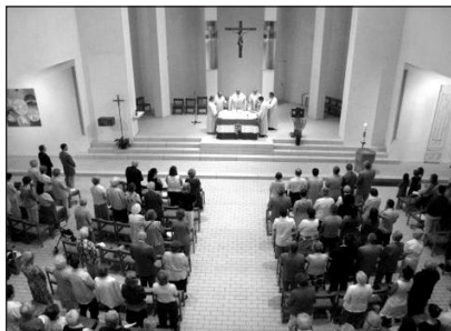
A zürichi magyar hívek minden évben megünneplik védőszentjüket

A püspök bevezető szavaival és szentbeszédében a keresztény élet gyakorlati feladataira buzdította az egybegyűlteket Szent István életpéldájára hivatkozva: