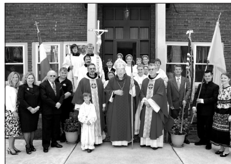
85 éve szentelték fel a magyar plébániatemplomot