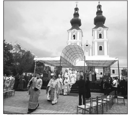
A kegytemplom megáldása része volt a hároméves jubileumi ünnepsorozatnak

A homília végén a bécsi érsek ajándékként átnyújtotta Fülöp püspöknek a bécsi Szent István-székesegyház egy kis darabkáját, valamint a Hajdúdorogi Egyházmegye védőszentjének, Szent István első vértanúnak és Bécs védőszentjének,