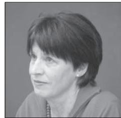
Gabriele Kuby szociológus

– Hogy velük dolgozzak? Természetesen igen. Meg akarok változtatni valamit, mert azt gondolom, hogy ez központi kérdés, mégis tabu. Nem beszélhetünk az abortuszról vagy a homoszexualitásról. Egyszer megkértek, hogy egy keresztény rendezvényen tartsak előadást a homoszexualitásról. Egy parlamenti képviselő pedig – aki maga is homoszexuális – mindent elkövetett, hogy erre ne kerülhessen sor. Miért ne lehetne előadást tartani, ami kiutat mutathatna a homoszexu-