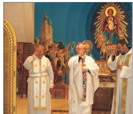
A New Jersey állambeli Matawanban, a görög katolikus bazilita atyák Máriapócs-kegyhelyén