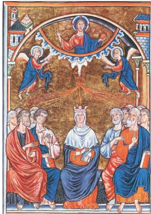
A Szentlélek eljövetele (Miniatűr, XII. sz. – Musée Condé, Chantilly)