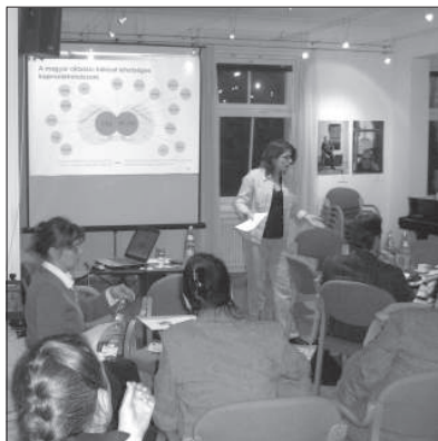
A szakmai találkozón a Németországban működő magyar gyermekcsoportokban és iskolákban oktatók vettek részt

Ahhoz, hogy a gyermekek valódi „kétnyelvűként” nőhessenek fel a német nyelvi környezetben, -oktatási rendszerben, s a magyar nyelvet mint második nyelvet használhassák, tudatosan oda kell figyelni az iskoláskor előtti fejlesztésre is. Erre alakultak a különböző bölcsődéi, óvodai csoportok. Mivel a „magyar iskola” ezekre a csoportokra, az itt folyó munkára épít, mely során a gyer-