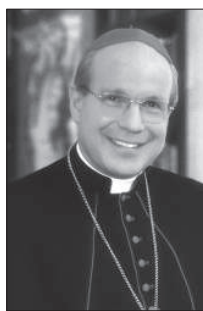
A kongresszus elindítója, Christoph Schönborn bíboros, bécsi érsek

A résztvevők ezt követően a kongresszus helyszínére, a Lateráni-bazilikába mentek, ahol a rendezvény elindítója, Christoph Schönborn bíboros, Bécs érseke köszöntötte a vilákgongresszus résztvevőit. Az elkövetkező napok délelőttjein több bíboros is előadást tartott, illetve tett tanúságot Isteni Irgalmasságáról. Így Ruini római, Dziwisz krakkói, Backis litván, Arinze nigériai, Ranjith Sri Lanka-i és természetesen Schönborn bécsi bíboros. Barbarin lyoni bíboros azokról a közös megmozdulásokról, zárandoklatról számolt be, amelyeket a muzulmán testvérekkel közösen tettek meg. A tanúságtévo főpapok között volt