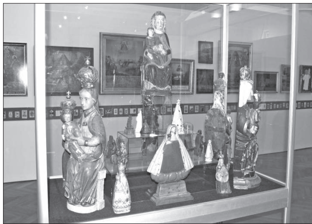
Mariazell 850 éves jubileumára nemzetközi vándorkiállítás nyílt május 18-án a szombathelyi Savaria Múzeumban. Több mint 400 tárgyat, másfélszáz fotót, térképet, grafikont, filmet, zenei anyagot, valamint egy rekonstruált nagycelli fotóstudiót tekinthet meg a látogató. A kiállítás szeptember 30-ig tart nyitva.